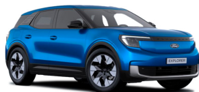
Modrá My Mind speciální metalická