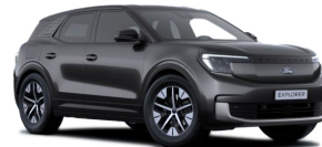
Šedá Magnetic metalická