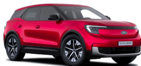
Červená Lucid speciální metalická